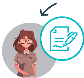
De medewerker of een vertrouwenspersoon